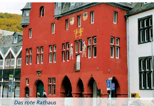
Das rote Rathaus