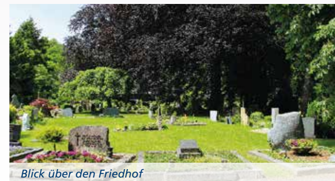
Blick über den Friedhof