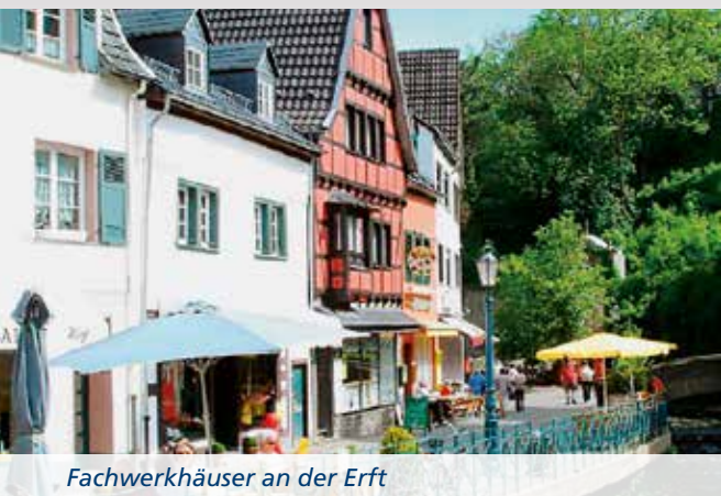
Fachwerkhäuser an der Erft