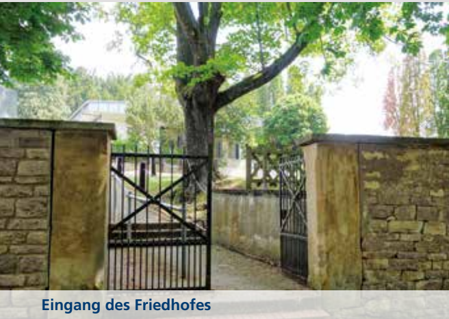
Eingang des Friedhofes