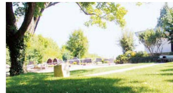
Blick über den Friedhof