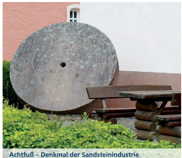
Achtfuß – Denkmal der Sandsteinindustrie

An diese Zeit erinnert der „Achtfuß“, ein Denkmal an die ehemalige Sandsteinindustrie. Sehenswert und beeindruckend ist der alte Brunnen mit Wasch- und Bleichplatz am Boor. Das Kuriose ist, dass er bis heute noch nie zugefroren ist. Weitere Sehenswürdigkeiten in Neidenbach sind die Marienkapelle am Röderweg, die Pfarrkirche St. Peter aus dem Jahre 1778 und der Dorfbrunnen in der Dorfmitte. Rund um Neidenbach gibt es vier beschilderte Wanderrouten durch die wunderschöne Waldeifel.