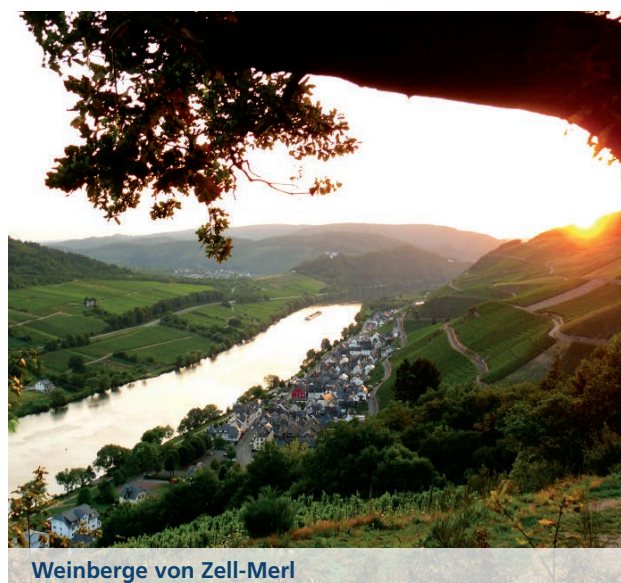
Weinberge von Zell-Merl