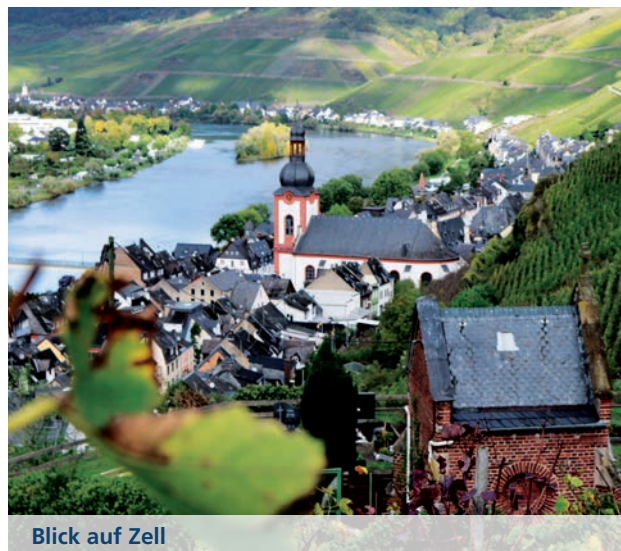
Blick auf Zell

Weitere Sehenswürdigkeiten in Zell sind die Burg Arras, aus dem Jahr 1120, die Marienburg aus dem Jahr 1100 und das Wein- und Heimatmuseum. Rund um Zell gibt es beschilderte Wanderrouten und Radwege. Sie führen durch die wunderschönen Weinberge oder direkt an der Mosel entlang.