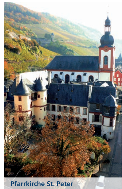
Pfarrkirche St. Peter